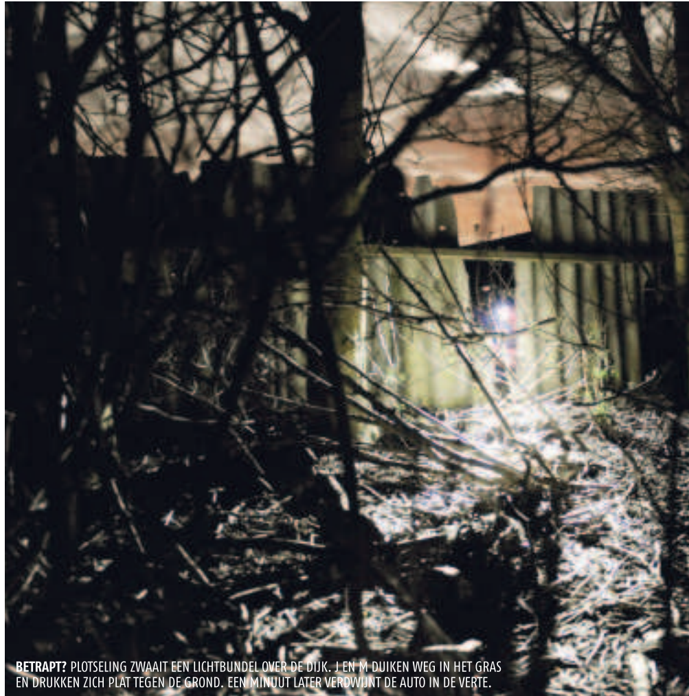
BETRAPPT? PLOTSELING ZWAAIT EEN LICHTBUNDEL OVER DE DIJK. J EN M DUIKEN WEG IN HET GRAS EN DRUKKEN ZICH PLAT TEGEN DE GROND. EEN MINUUT LATER VERDWIJNT DE AUTO IN DE VERTE.

Het plan voor straks is uitgebreid: de farm binnenkomen, zo veel mogelijk nertsen over de omheining