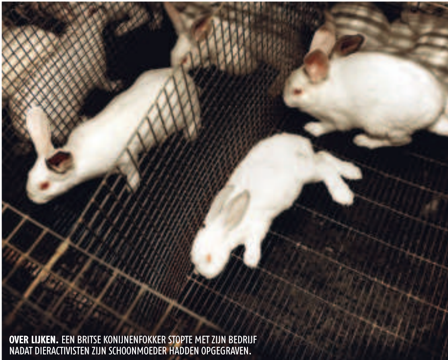
OVER LIJKEN. EEN BRITSE KONIJNENFOKKER STOPTE MET ZIJN BEDRIJF NADAT DIERACTIVISTEN ZIJN SCHOONMOEDER HADDEN OPGEGRAVEN.