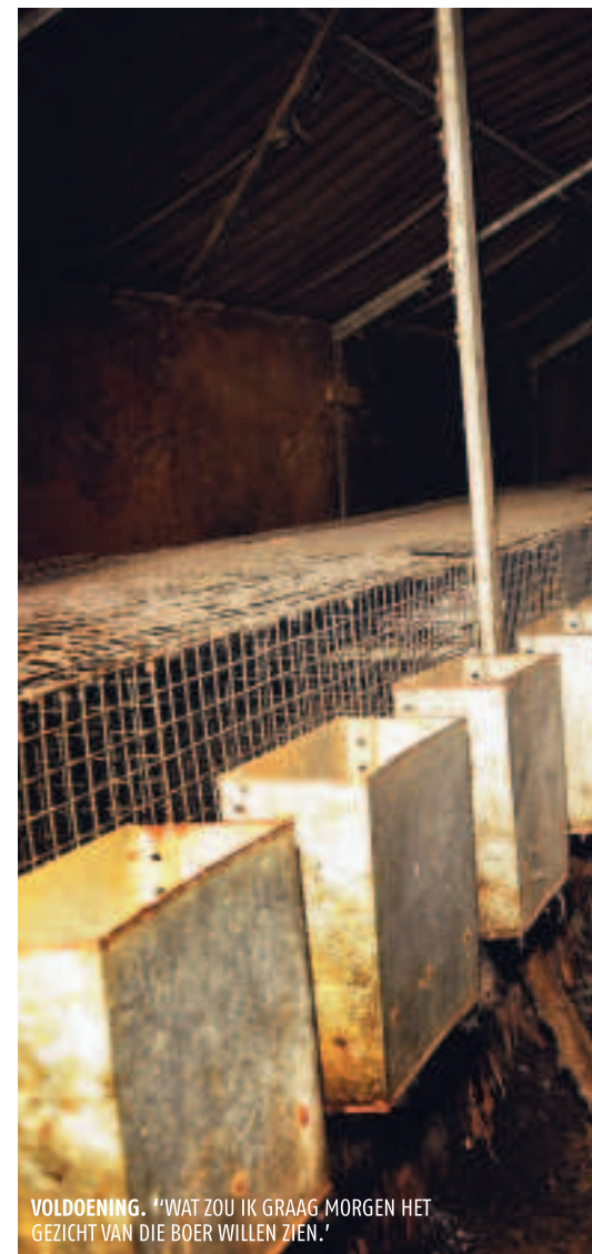
VOLDOENING. 'WAT ZOU IK GRAAG MORGEN HET GEZICHT VAN DIE BOER WILLEN ZIEN.'

M laat een zware vuilniszak over de omheining ploffen. Ze klimt er zelf achteraan en sjouwt de zak naar de sloot waar ze hem met een ruk omkeert. Een windvlaag neemt honderden gekleurde kaartjes mee en strooit ze uit over het water. Langzaam drijven de kaartjes met de stroom mee. J komt terug met een tweede zak maar op dat moment draait een auto van de dijk af het kleinere weggetje op. De twee laten zich verschrikken op hun buik vallen. Een paar honderd meter verderop mindert de auto