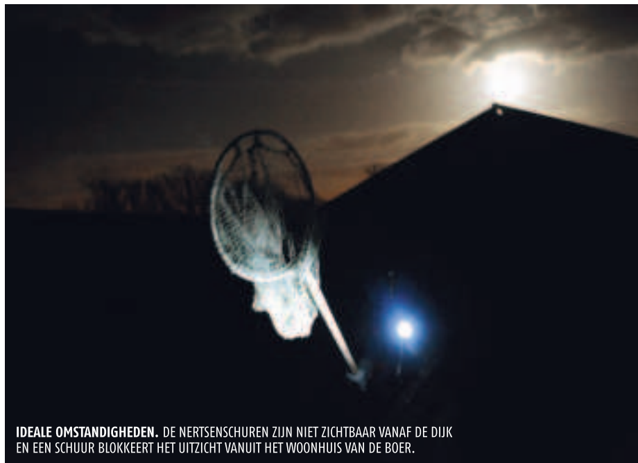
IDEALE OMSTANDIGHEDEN. DE NERTSENSCHUREN ZIJN NIET ZICHTBAAR VANAF DE DIJK EN EEN SCHUUR BLOKKEERT HET UITZICHT VANUIT HET WOONHUIS VAN DE BOER.

'We hebben geluk dat deze fokker dom is. Die man weet dat het DBF bestaat, maar beveiligd zijn bedrijf niet beter. Dan vraag je erom'