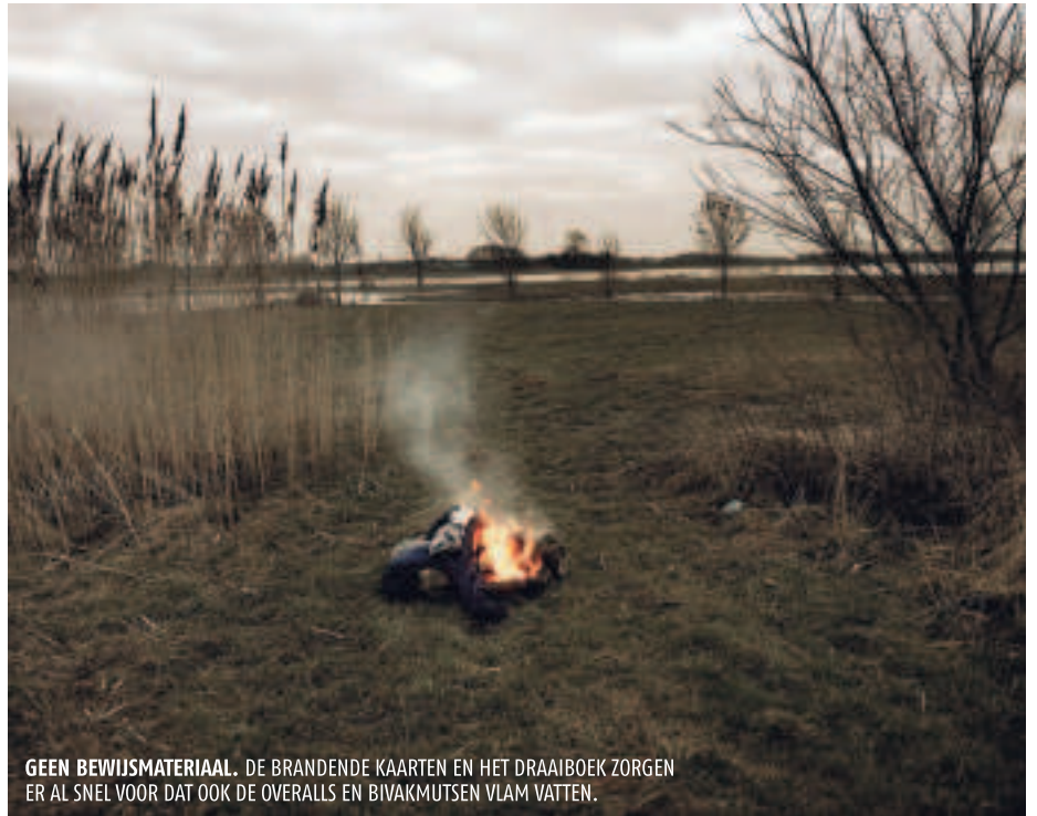
GEEN BEWIJSMATERIAAL. DE BRANDENDE KAARTEN EN HET DRAAIBOEK ZORGEN ER AL SNEL VOOR DAT OOK DE OVERALLS EN BIVAKMUTSEN VLAM VATTEN.

Even kijken ze elkaar aan, dan knikken J en M naar elkaar en stappen de eerste schuur binnen. In het smalle middenpad kunnen ze net naast elkaar staan. Met een zachte klik veren de deurtjes van de eerste kooien open. De verbaasde nertsen kijken een tel onzeker rond en verdwijnen dan met een sprong in de donkere schuur. Met de ruggen tegen elkaar werken J en M in hoog tempo door. Met twee handen tegelijk openen ze de metalen kooien. Het gekrijs in de schuur klinkt oorverdovend. Overall rollen vechtende nertsen over de grond.