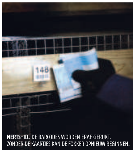
NERTS-ID. DE BARCODES WORDEN ERAF GERUKT. ZONDER DE KAARTJES KAN DE FOKKER OPNIEUW BEGINNEN.