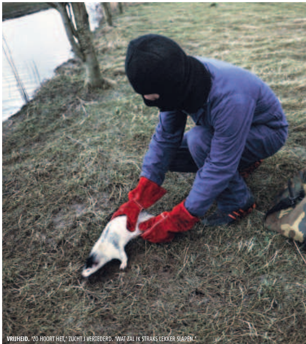
VRIJHEID. 'ZO HOORT HET,' ZUCHT J VERTEDERD. 'WAT ZAL IK STRAKS LEKKER SLAPEN.'